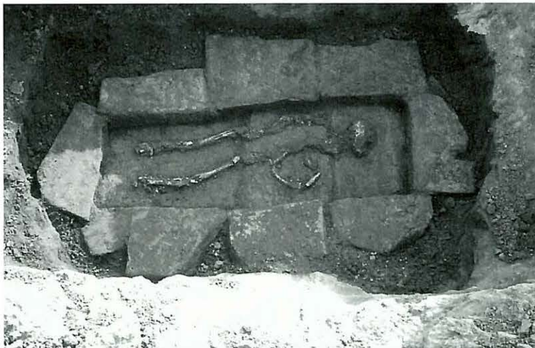
La tomba alla Cappuccina rinvenuta nel territorio del Comune di Novi in località Foresto di epoca Altomedioevale.