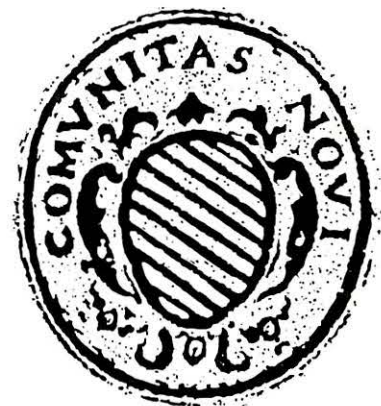
Il Gruppo Storico Novese

Le stesse nove fasce le troviamo nell'attuale stemma del nostro Comune ed è ragionevole dedurre che sia stato voluto come scelta di continuità e di identificazione a simbolo del nostro territorio e della nostra Comunità.