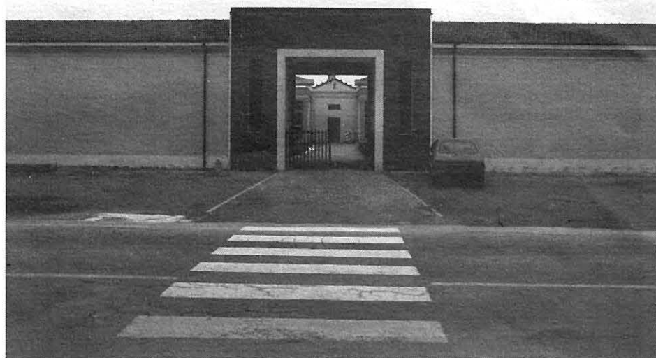
Il Cimitero di Rovereto s./S.