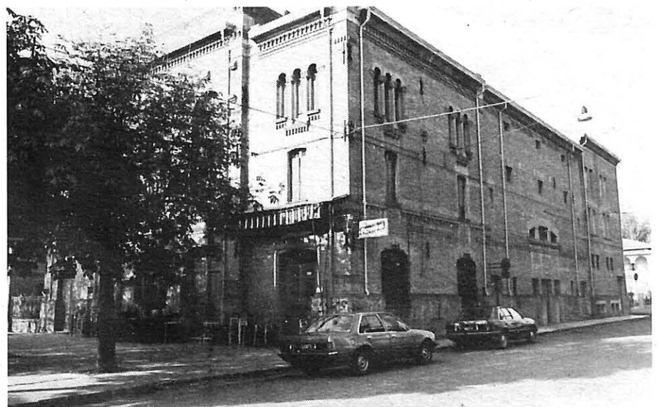
Il Teatro Sociale di Novi.

Ora si tratta di reperire i fondi per l'acquisto e la ristrutturazione e ciò sarà possibile quando il Consiglio Comunale ne avrà deliberato l'acquisto.