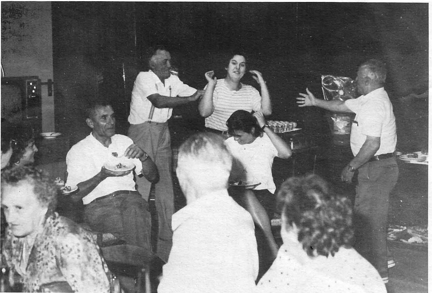
La "terza età" si diverte in vacanza.

l'ambito degli interventi sociali che il Comune attua a favore della terza età. È un momento, questo, di svago, socializzante e salutare. Offre agli anziani, anche in condizioni economiche non agiate, la possibilità di una vacanza che, sotto il profilo della socializzazione, presenta tutti i requisiti indispensabili. Gli altri due aspetti crediamo siano in sintonia con le aspettative dei partecipanti.