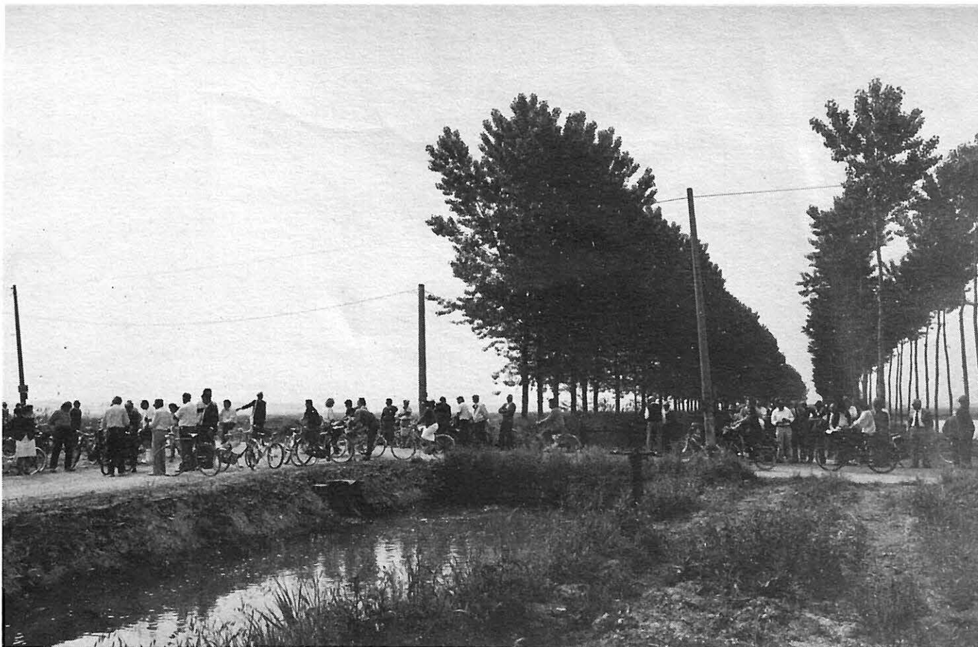
Bicicletta ecologica in occasione delle inaugurazioni della nuova fonte idrica e del depuratore di Rovereto s/S.

di FIO, naturalmente si darà priorità a quei Comuni nei quali la concentrazione di allevamenti è maggiore. Nella nostra provincia 14 sono questi Comuni, Novi non ne fa parte.