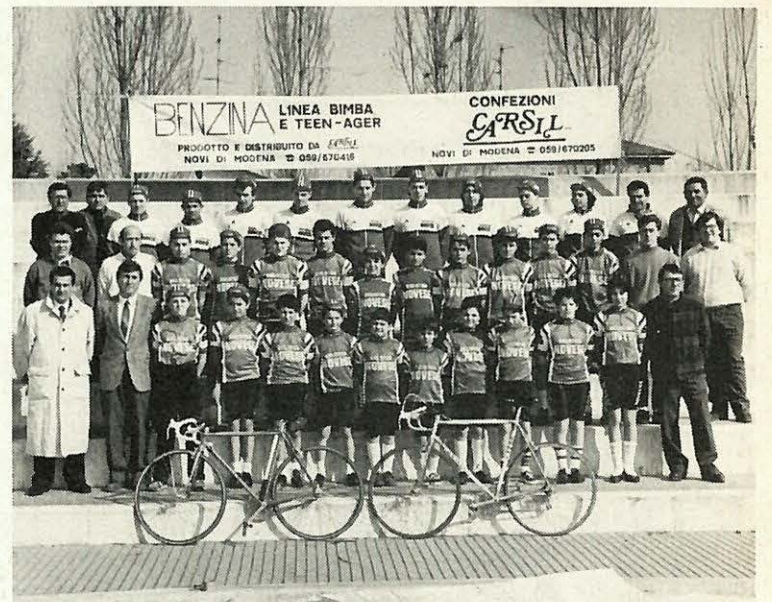
CICLISTICA NOVESE 1988 - Gli atleti e i dirigenti.