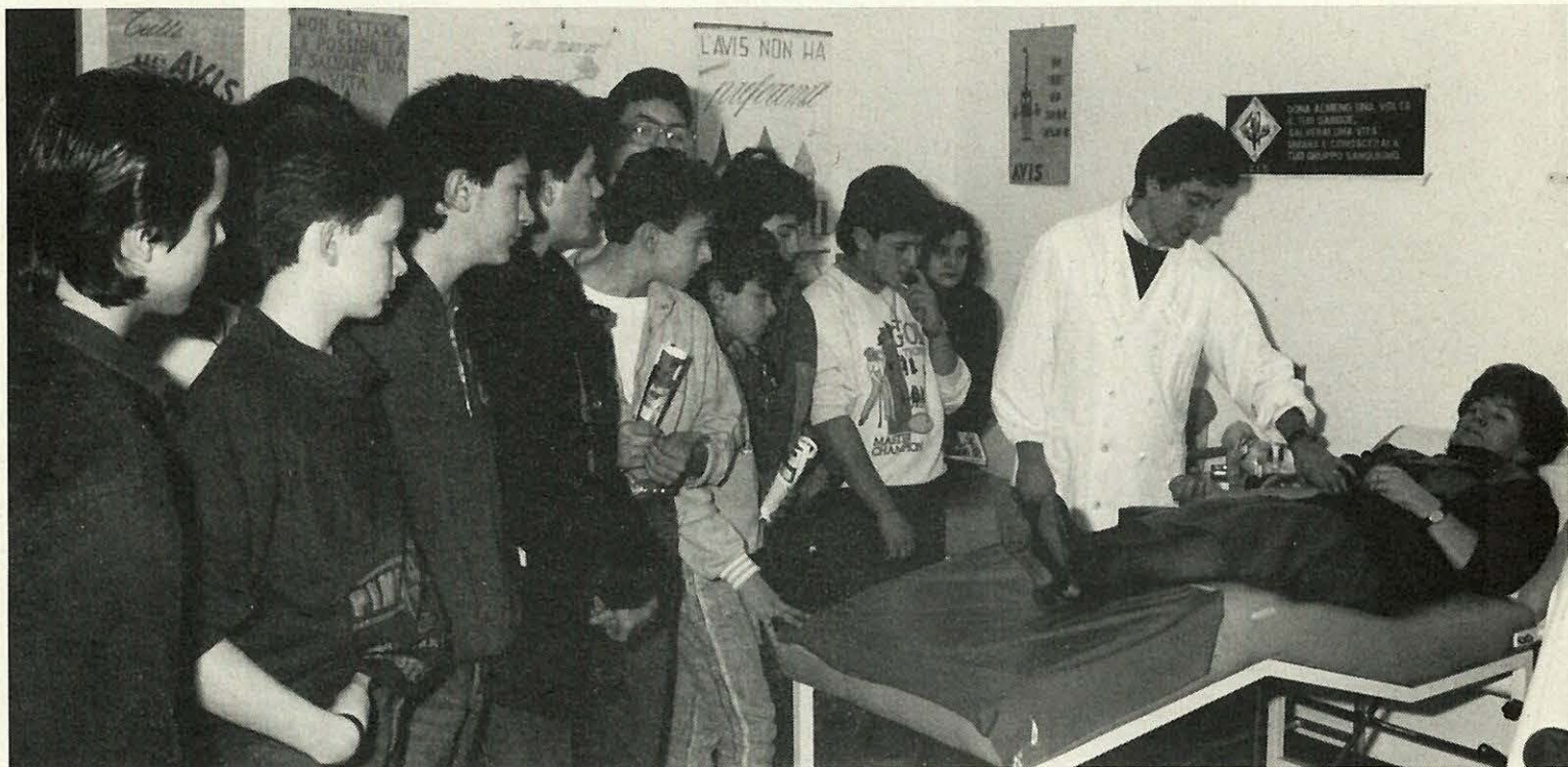
Alunni della Scuola Media di Novi (classi III) in visita alla sede AVIS.

È finito anche il 1987 e come è consuetudine è tempo di bilanci, di resoconti, di impegni, di promesse future per l'anno che è arrivato. Per l'A.V.I.S. di Novi il 1987 è stato un anno certamente positivo. Basta guardare i dati della sezione e le iniziative fatte e quelle già programmate per l'anno in corso: