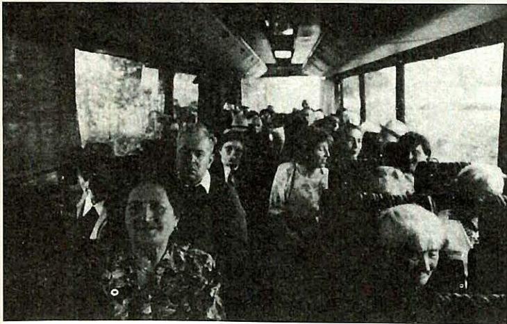
Ospiti delle Case di Riposo di Novi e di Carpi sul pulmann che li porterà a Riccione.

L'Opera Pia Casa di Riposo «Roberto Rossi» di Novi di Modena, sorta per ospitare anziani bisognosi autosufficienti è andata gradualmente trasformandosi in una struttura in grado di accogliere un'utenza composta in prevalenza da anziani non autosufficienti (circa il 77%) che per condizioni di disabilità stabilizzate, psichiche o fisiche, o per avanzata senilità, richiedono cure ed assistenza continua.