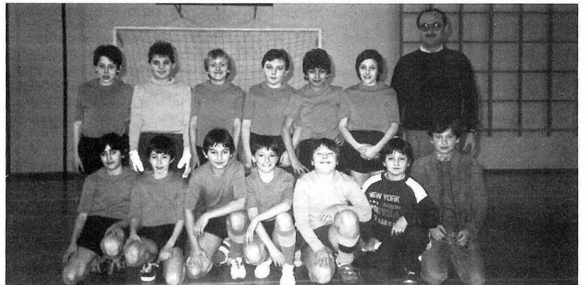
Hanno dominato in lungo e in largo i giovanissimi Piccoli Azzurri «C» nel Campionato di calcio dell'UISP di Carpi.

Per chi vuole immergersi più a lungo nei ricordi della memoria sono previste due serate di proiezioni delle diapositive originali: domenica 13 luglio ore 21 e lunedì 14 luglio ore 21 nella Sala del CNN presso la Taverna.