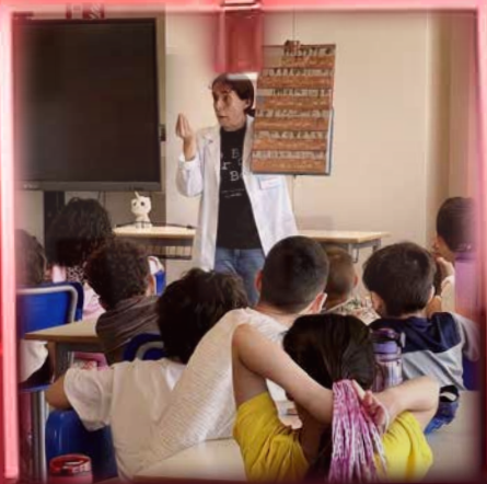
Mese della Scienza