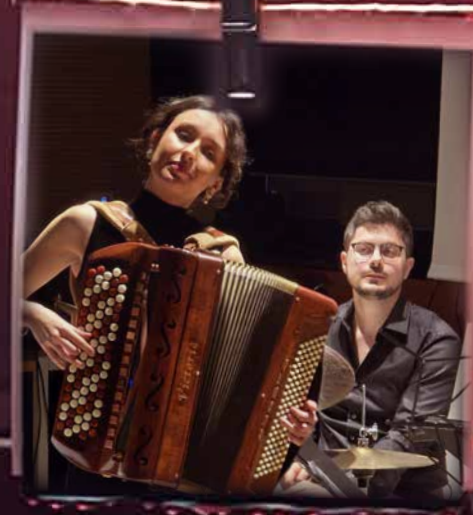
Novi Music Fe