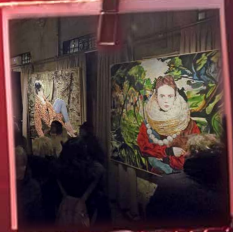
Hamlet Mostra di Andrea Saltini