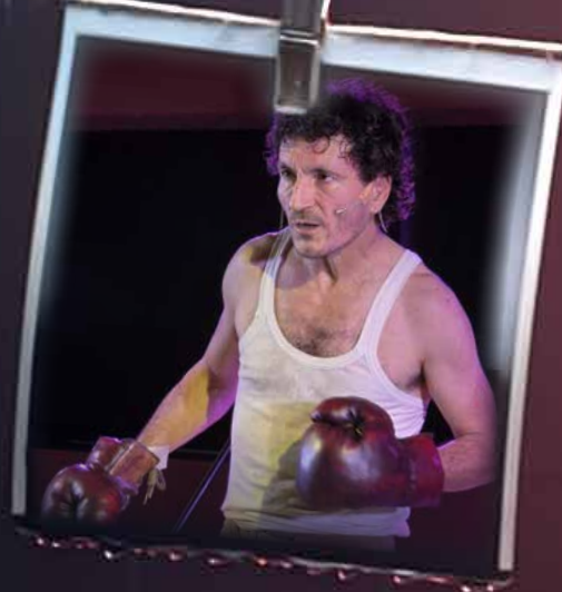
Rassegna Teatrale Agorà

Ecco le immagini di alcuni degli eventi proposti: