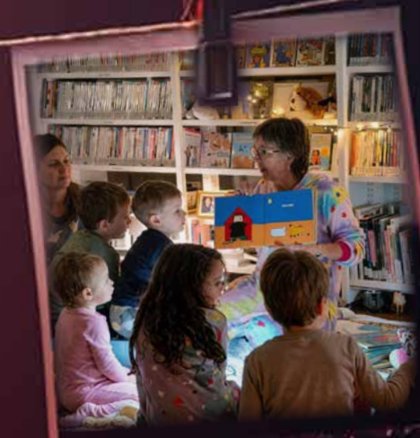
Notte dei Puppazzi