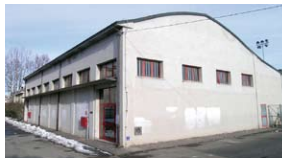
L'attuale palestra (in alto) e quella futura (in basso)

Nel 2010, con una variante specifica al Piano Regolatore Generale, il Comune destinerà un'area per la nuova caserma dei Carabinieri; l'investimento relativo alla costruzione sarà a carico del privato.