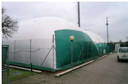
Il nuovo pallone pressostatico al Centro "I Campetti"

Il sacrificio economico chiesto nel 2010 al volontariato sportivo non altera né sminuisce il valore sociale che questa amministrazione attribuisce al lavoro di tutti coloro che mantengono efficienti e attive le strutture comunali. Di particolare rilievo sono le iniziative che coinvolgono gli adolescenti nella pratica sportiva e, poiché tutte le associazioni sono attive in questo, sono confermati i contributi per l'avviamento allo sport come negli anni precedenti.