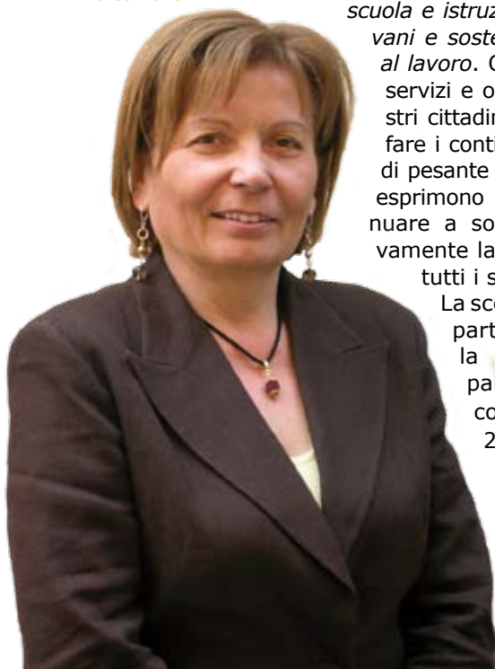
Il Sindaco Luisa Turci

Tra i principali risultati del lavoro fin qui svolto possiamo citare, per il 2010, il mantenimento dell'importo attuale delle rette dei servizi scolastici e dei trasporti, così come la conferma di riduzione delle rette alle famiglie in difficoltà a causa della crisi economica, registrando, nel contempo, un aumento di fruizione dei servizi mensa e trasporto scolastico».