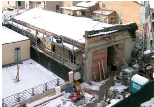
I lavori di ristrutturazione della nuova Sala Civica di Rovereto in basso: particolare delle travi in legno

Con il coinvolgimento di musicisti locali, è stato ideato un Festival della Musica per la cui realizzazione è stato chiesto un importante finanziamento alla Fondazione Cassa di Risparmio di Carpi. Il Festival, a cadenza annuale, verrebbe localizzato a turno sui tre centri, e connoterebbe anche all'esterno il Comune di Novi.