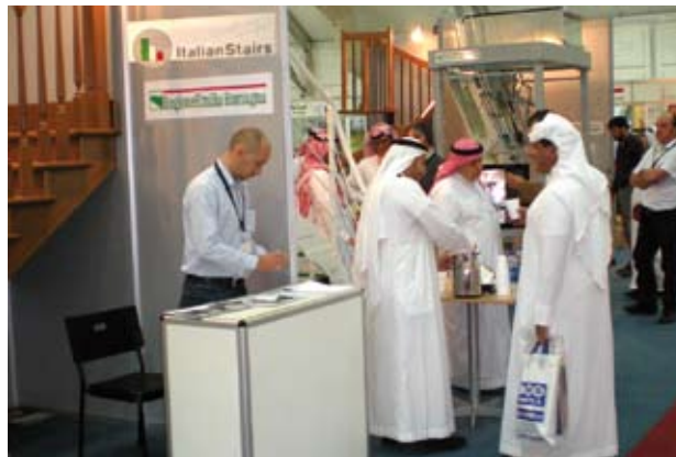
Il comparto scale in fiera a Ryad con il marchio "Italian Stairs"

Sia a Novi che a Rovereto sono disponibili aree per insediamenti produttivi , ma nel 2009 solamente tre imprese hanno acquistato terreni, pur dovendo prorogare l'inizio dei lavori a causa degli effetti della crisi economica.