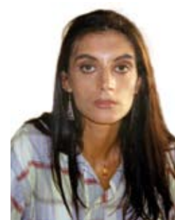
di Tania Andreoli

N on è bastata la crisi della maggioranza, resa pubblica in occasione della seduta consiliare del 01/02/2010, in una Sala Civica gremita di persone, come non si era mai visto, in occasione della discussione del Bilancio di Previsione 2010, sul quale 3 esponenti della stessa hanno espresso voto contrario: ora questa Amministrazione, in violazione dei principi costituzionali, nonché del Testo Unico degli Enti Locali (D.Lgs. n.267/200), vorrebbe unilateralmente mettere a tacere alcuni Consiglieri dell'opposizione, violando un sacrosanto diritto, quello degli elettori di essere equamente rappresentati all'interno degli Enti Locali.